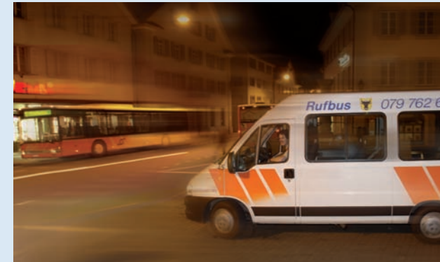
Für Nachtschwärmer besonders geeignet: Der Rufbus fährt Samstag und Sonntag bis 2 Uhr morgens.

gerem Thema bei der AUTO AG URI. Die Pläne liegen bereit. Urs Haener hofft, dass mit den Bauarbeiten Ende 2007 begonnen werden kann. «Unser Ziel ist es, dass wir unser neues Betriebsgebäude im Herbst 2008 beziehen können», sagt er. Der Neubau wird an der Umfahrungsstrasse in Schattdorf zu stehen kommen, eine zentrale Lage für die gut vernetzte AUTO AG URI.