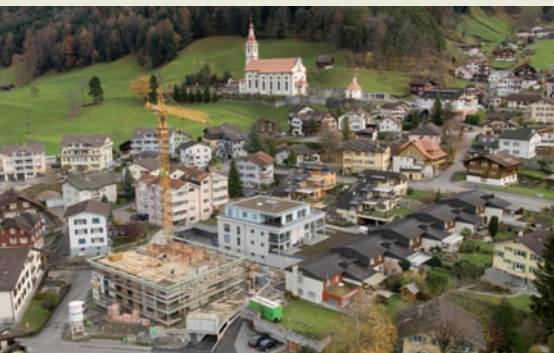
Im 11. Jahrhundert stand im Mühlehof der Wohnturm von Schattdorf. Nun entstehen hier zwei Mehrfamilienhäuser.