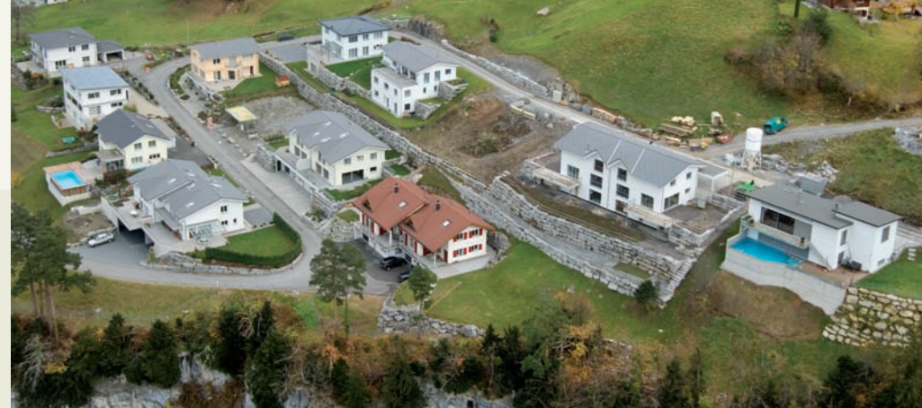
In der Wohnüberbauung Achern entstehen individuelle Wohnhäuser auf Kundenwunsch mit einmaliger Aussicht über den Urner Talboden.

Die Auftragslage hat sich in den vergangenen Jahren verbessert. Auch das geplante Grossprojekt in Andermatt und der Neue Finanzausgleich wirken sich positiv auf die Urner Wirtschaft aus. «Wir merken den Aufschwung. Die Leute haben wieder mehr Zuversicht und sind bereit zu investieren», sind sich die beiden einig. Investiert wird beispielsweise in ein eigenes Haus oder eine eigene Wohnung. Diese Kundinnen und Kunden machen einen wichtigen Teil der Aufträge der Robert Gamma AG aus. Die Unternehmung ist aber auch immer wieder an wichtigen Bauprojekten beteiligt. So führen sie derzeit die Bauarbeiten des aktuell grössten Urner Wohnungspro-