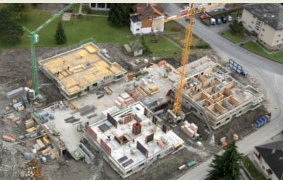
Die Robert Gamma AG baut am grössten Urner Wohnbauprojekt in der Schattdorfer Eyrütti mit.

Was vor mehr als 40 Jahren als Einzelfirma begann, hat sich zu einer Unternehmung mit rund 70 Mitarbeitern entwickelt. Obwohl in der Baubranche ein rauer Wind weht, weiss sich die Robert Gamma AG dank Qualität und einem erfahrenen Team auf dem Markt zu behaupten.