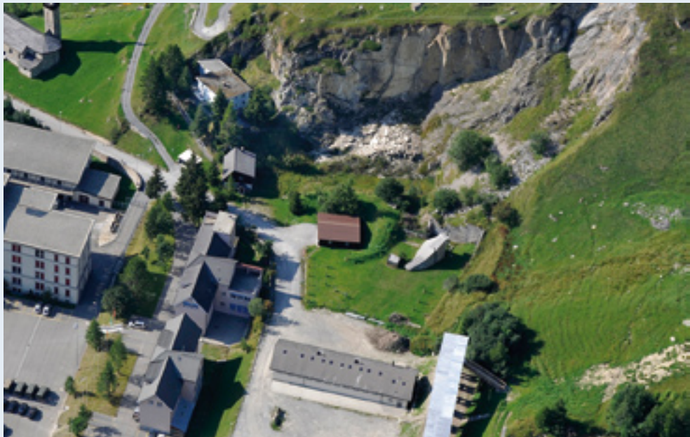
Das Spielgelände der Suworow-Freilichtspiele 2010 hinter der Kaserne in Andermatt.