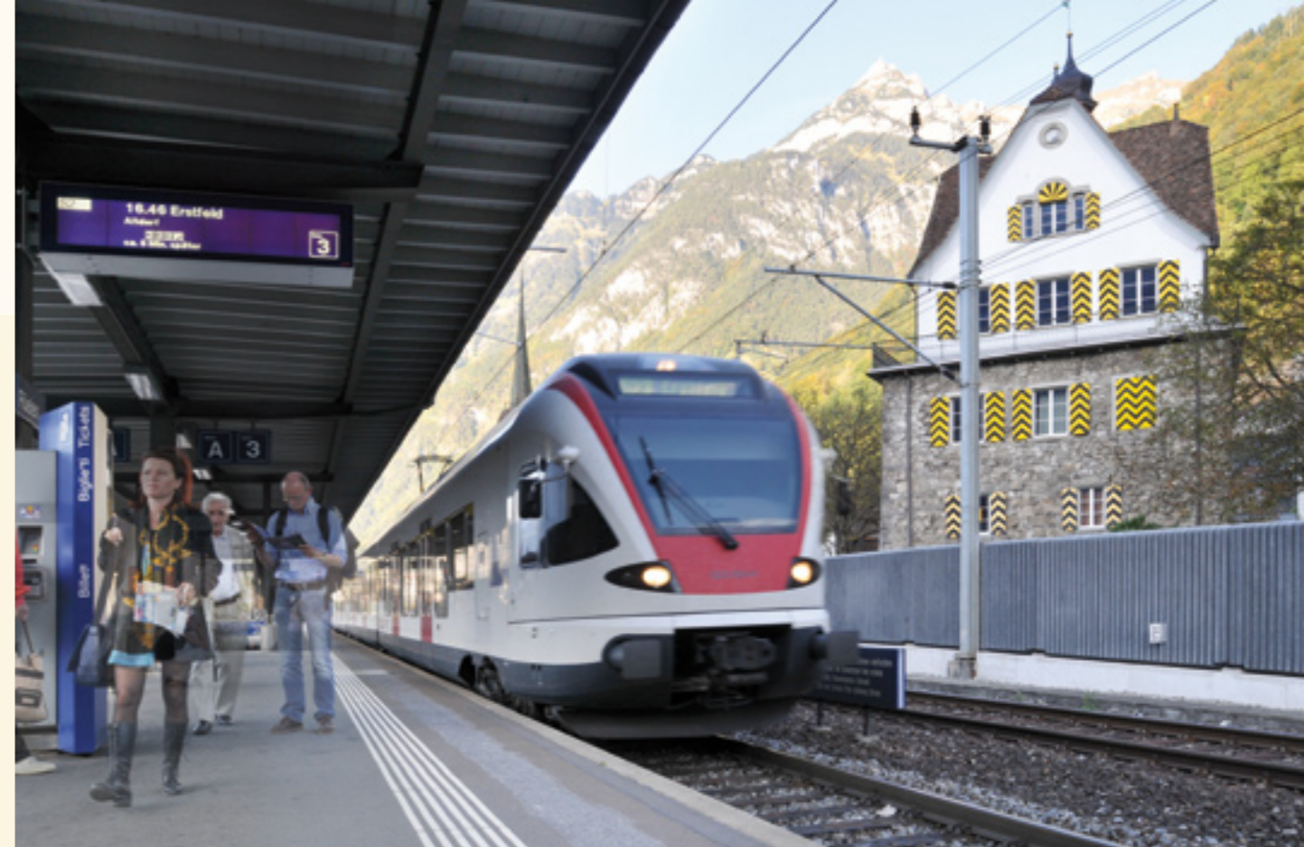
Seit dem Fahrplanwechsel pendelt es sich noch einfacher aus und nach Uri.

Eine zweite wichtige Verbesserung gibt es im schienengebundenen Regionalverkehr. Hier schuf der Fahrplanwechsel neue attraktive Spätverbindungen von Zürich/Zug und Luzern nach Uri. Damit können die Urnerinnen und Urner neu auch nach Mitternacht mit dem öffentlichen Verkehr heimreisen (siehe Box). Zudem ergänzt eine Frühverbindung von Erstfeld direkt nach Luzern das Angebot in die Agglomeration Luzern. Weitere zusätzliche Leistungen zu den Übergängen von der Bahn zum Bus gibt es am Morgen in Erstfeld und Flüelen. Von den neuen Transportketten profitiert auch das Urner Oberland. Aber nicht nur auf der Hauptachse wurde der Fahrplan verbessert, sondern auch für die Seitentäler – immer in Abstimmung mit den betroffenen Gemeinden. «Die Zusammenarbeit funktioniert meist ausgezeichnet», sagt Thomas Aschwanden von der dafür zuständigen Volkswirtschaftsdirektion Uri. «So konnten wir zwar nicht alle, aber doch sehr viele Kundenanliegen erfüllen.»