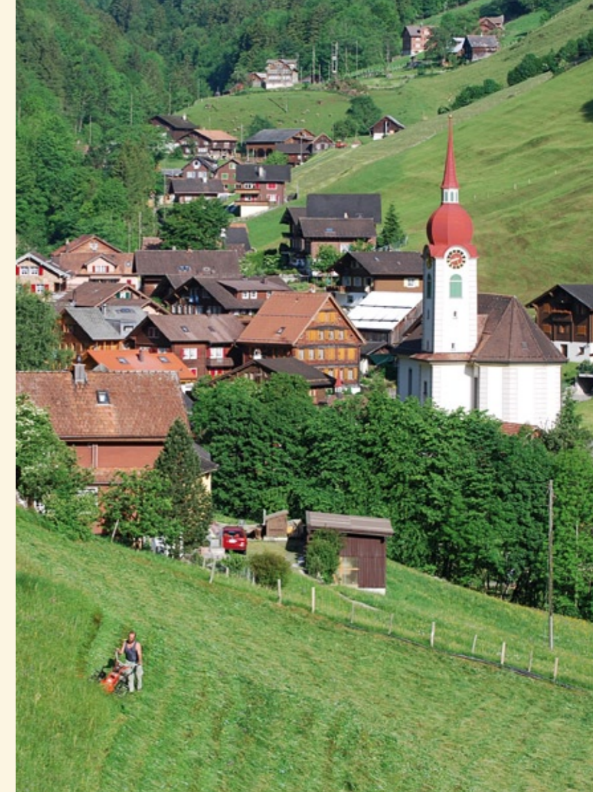
Isenthal ist eine der zwölf Naturparkgemeinden.