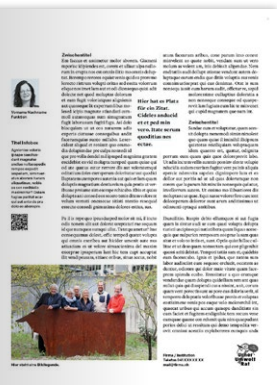
Publireportage 1 Seite