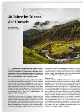
Publireportage 2 Seiten

Wir freuen uns sehr! Jetzt steht nämlich die Jubiläumsausgabe Nr. 40 von image an. Sie wird Ende Juni 2024 in neuem Design erscheinen, in alle Urner Haushalte geliefert und in der Folge an diversen Stellen während mehrerer Monate aufliegen. Das Urner Magazin bietet auch in seiner nächsten Ausgabe vielseitige Rubriken und Angebote für Ihre Erfolgsgeschichten. Zusammen mit ausdrucksstarken Bildern bringen wir Ihre Inhalte optimal zur Geltung und setzen gemeinsam mit Ihnen starke Impulse.