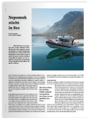
Publireportage 1 1/2 Seiten